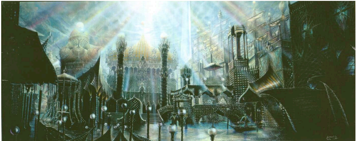
Yin Yang © Angerer der Ältere