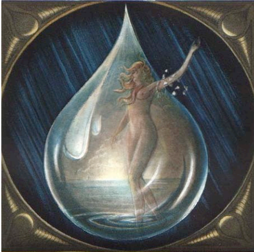
„Venus“, Farbradierung, Angerer der Ältere